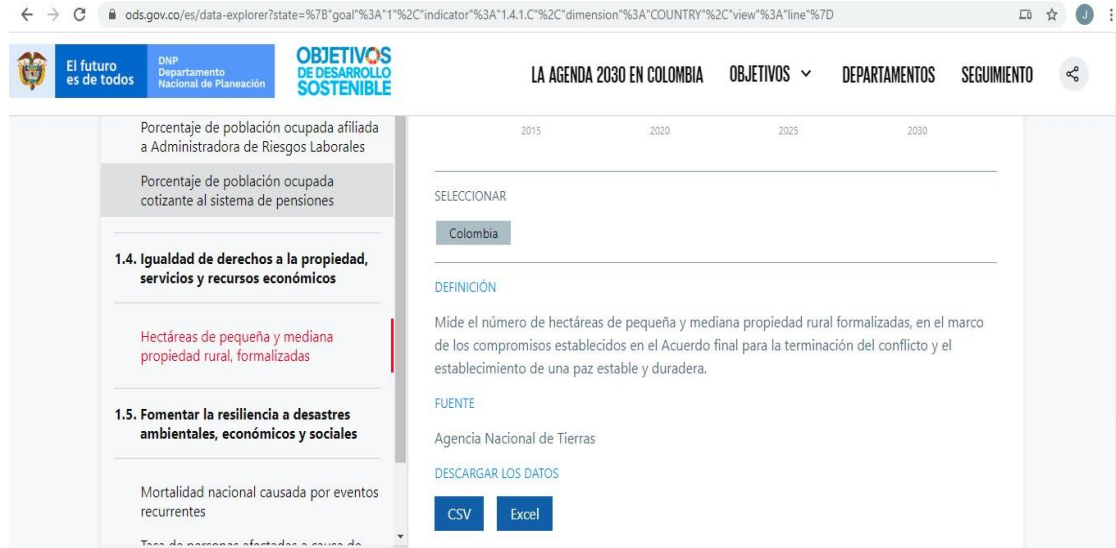
Gráfico No. 5 Plataforma ODS gobierno nacional