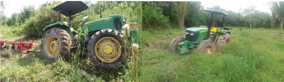
Tractor del proyecto, enterrado

Por lo anterior, se requiere un tractor con mayor potencia de trabajo, que tenga la modificación al bómper y que incluya una pala raspadora capaz de mover volúmenes de tierra para la nivelación del terreno, y que ofrezca mayor efectividad en el trabajo, ya que los tractores adquiridos no cuentan con estas defensas. Estos hechos evidencian gestiones antieconómicas que no maximizan el recurso y no permiten la obtención de resultados en forma oportuna y efectiva.